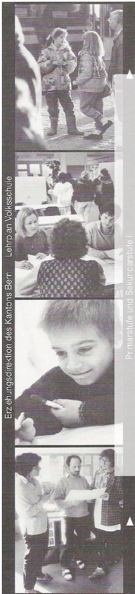
Erziehungsdirektion des Kantons Bern | Lehrplan Volksschule | Primarstufe und Sekundarstufe I